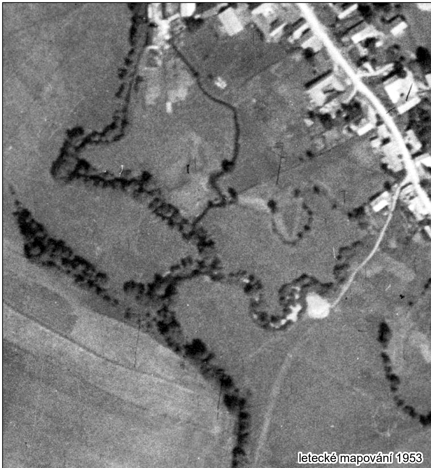
letecké mapování 1953